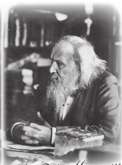
В. И. Вернадский