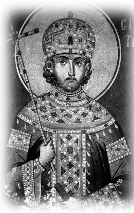
Святой Константин Великий. XIV в.