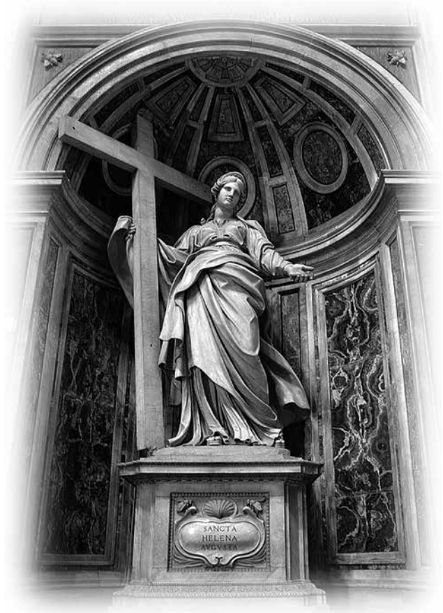
Статуя святой Елены в Соборе святого Петра. Ватикан