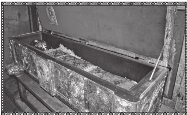
Рака с мощами преподобной Анастасии в монастыре Студеница

да, и их значение для государственности и культуры. Младший сын Растко стал великим подвижником, отцом, основателем и строителем самостоятельной Сербской Церкви, первым архиепископом Сербским Саввой, а средний сын Стефан Первовенчаный — выдающимся правителем, наследовавшим престол и державу своего отца.