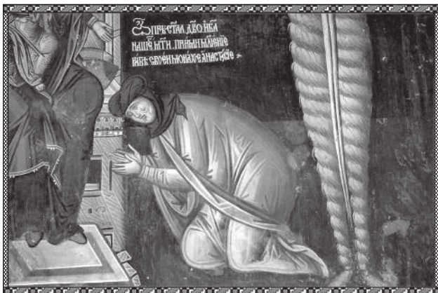
Моление преподобной Анастасии. Фреска в монастыре Студеница

Рядом с местом ее первоначального захоронения на стене храма можно увидеть фресковое изображение монахини Анастасии, припадающей к престолу Пресвятой Богородицы со словами молитвы: «О, Пресвятая Дева и Бога Нашего Мати, прими моление рабы Своей, монахини Анастасии».