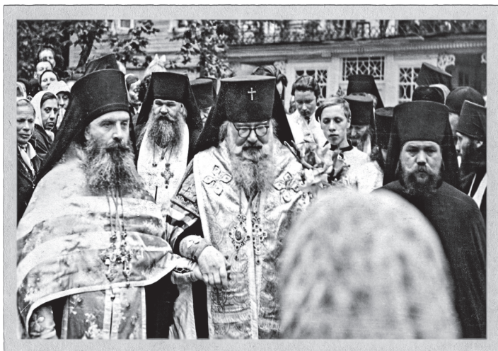
Архиепископ Псковский Иоанн (Разумов) с архимандритом Алипием (Вороновым)

стали устраивать безобразия в храмах во время богослужения, попытки сопротивления приводили к закрытию храмов. Еще 16 мая 1959 года патриарх Алексий и митрополит Крутицкий Николай обратились с письмом к Н. С. Хрущеву, в котором сообщали о незаконном закрытии храмов, оскорблении религиозных чувств духовенства и верующих, о травле, незаконных административных мерах против Церкви. Это письмо, как и ряд других обращений, осталось без ответа.