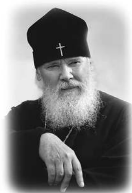
Патриарх Алексий II

Жизни, каждое мгновение которой было обращено к Богу, посвящена эта книга.