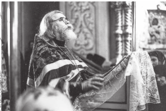
Проповедь, 1980-е годы

общение человеческое, приближающее их к Духу Христову. И на этой первой ступени добра, о которой Господь сказал как о подаче стакана воды «во имя ученика», могут стоять все, как и правильно понимать эти слова Христовы и стремить-