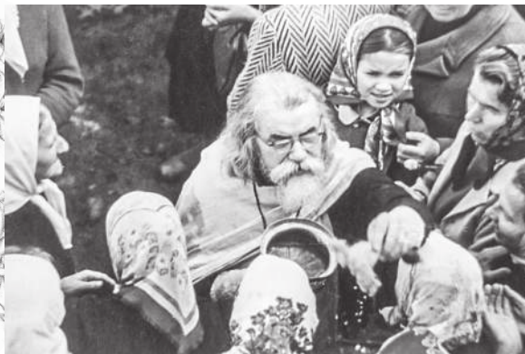
Окропление святой водой, 1980-е годы

Дивный путь «малых дел», пою тебе гимн! Окружайте, люди, себя, опоясывайтесь малыми делами добра — цепью